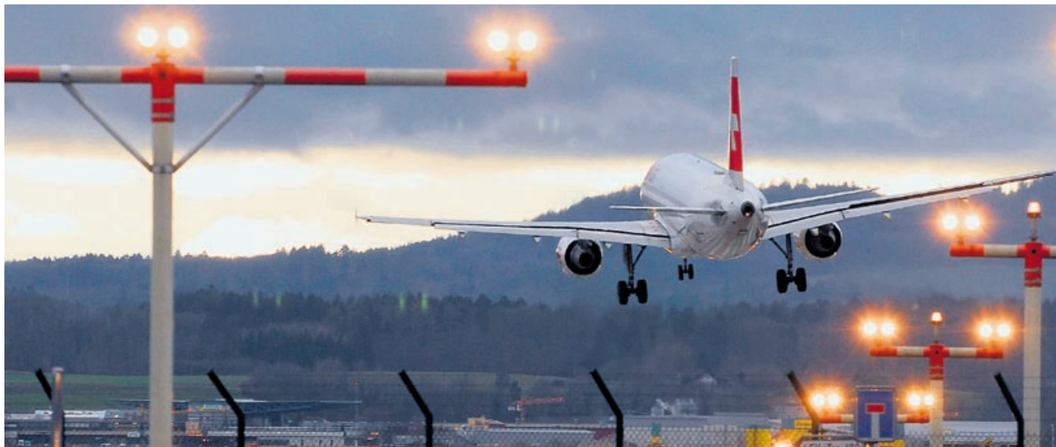
Fluglärm ist ein Thema, das nicht nur die Gemeinden im Osten des Kantons betrifft. Die Kantonsräte spannen hier deshalb über die Regions- und Parteigrenzen hinweg zusammen.